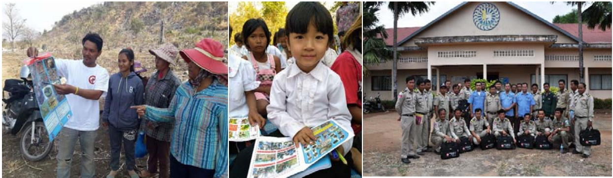
រូបភាពកម្មវិធី (CBURR)